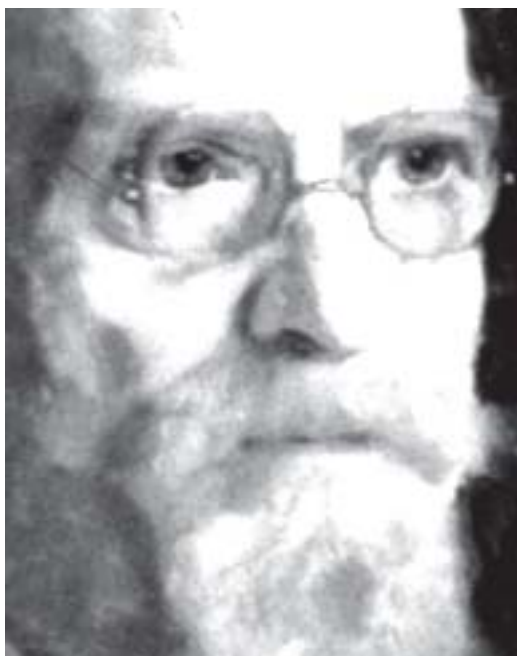
Husserl / modificado

Não é, justamente, essa a principal crítica que endereça Wittgenstein a Frazer – quando este interpreta os hábitos e rituais mágicos de certos povos como sendo absurdos, contraditórios e, portanto, irracionais e primitivos? Crítica às interpretações, na verdade ideológicas, de outras culturas desconhecidas segundo o modelo de uma cultura conhecida, aquela do cientista que tudo compara e julga de acordo com as normas de sua própria gramática cultural. Afirmar que o mundo se aniquila ao perder sua