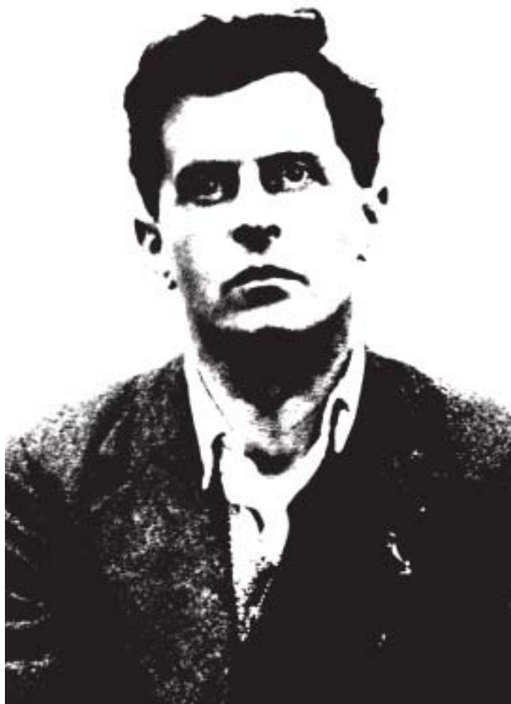
Wittgenstein / modificado