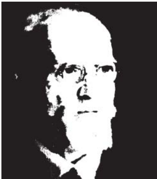
Husserl / modificado

Ao revelar a essência própria da consciência, a atitude fenomenológica reconhece a importância do Wie não absoluto como correlato indispensável da consciência em geral. O princípio fundamental da fenomenologia, segundo o qual “não há consciência sem conteúdo”, significa apenas que o conteúdo real e essencial da consciência é a percepção . não há consciência sem percepção de conteúdos. E assistimos, neste ponto, mais uma vez, a inversão dos usos conceituais característicos das duas atitudes. De fato, a afirmação recíproca de que “não há conteúdo sem consciência”, de natureza plenamente fenomenológica, aplica o termo “conteúdo” como conceito relativo aos perfis, aos modos de doação, aos atos conscientes, em outros termos, ao Wie não absoluto. Por sua vez, a primeira