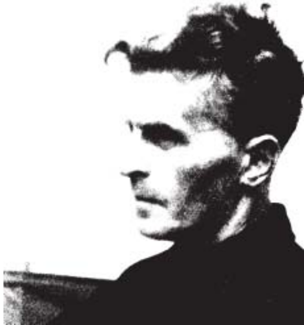
Wittgenstein / modificado

Ao apreender as ligações eidéticas através da redução fenomenológica, Husserl estaria, do ponto de vista de Wittgenstein, descrevendo regiões gramaticais particulares em que a adesão em torno de atos intencionais seria a garantia da intersubjetividade, para além, está claro, da multiplicidade dos juízos. E abre-se, neste ponto, outro aspecto em torno do qual, mais uma vez, os dois projetos filosóficos tendem a separar-se. De fato, Husserl funda a intersubjetividade em uma experiência elementar, de origem psicológica, mas que, em princípio, transcende-a apontando para uma ligação mais forte, e não mais psicológica, entre experiências de constituição do sentido. É a experiência de “empatia” ( Einfühlung ), na