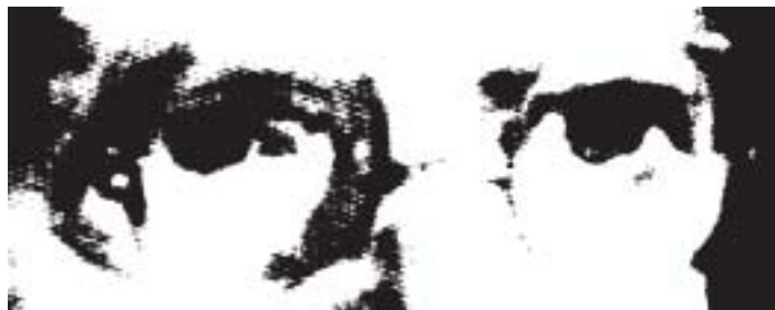
Husserl / modificado

A variação eidética poderia ser interpretada, wittgensteinianamente, como a exploração das ligações internas presentes na gramática de nossos conceitos habituais, dos quais parte e os quais não tenta superar. A essência está, nesse sentido, presente nessa particular gramática – o que já seria um julgamento dogmático, segundo Wittgenstein, caso pretendesse afirmar, com isso, o caráter definitivo da essência, subtraindo-lhe a natureza essencialmente lingüística e convencional. As próprias regiões