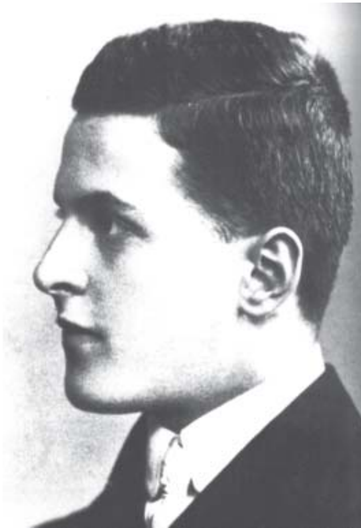
Ludwig Wittgenstein com aproximadamente dezoito anos

Esse é o sentido que Husserl atribui às ciências eidéticas, prévias às ciências positivas empíricas, e esclarecedoras de seus conceitos ao delimitarem as respectivas regiões ontológicas para sua aplicação adequada. As formas categoriais das ciências formais, Matemática e Lógica, e as essências materiais das ciências naturais e a Geometria – assim como as essências materiais das ciências humanas, a serem ainda analisadas, de que a psicologia fenomenológica seria um primeiro exemplo – formariam o conjunto de temas para as ciências eidéticas, plenamente conscientes de suas categorias e domínios ontológicos respectivos. Não é esse o caso das ciências positivas: ainda que precedidas pelas eidéticas, não abririam mão de seu objeto, a espacialidade