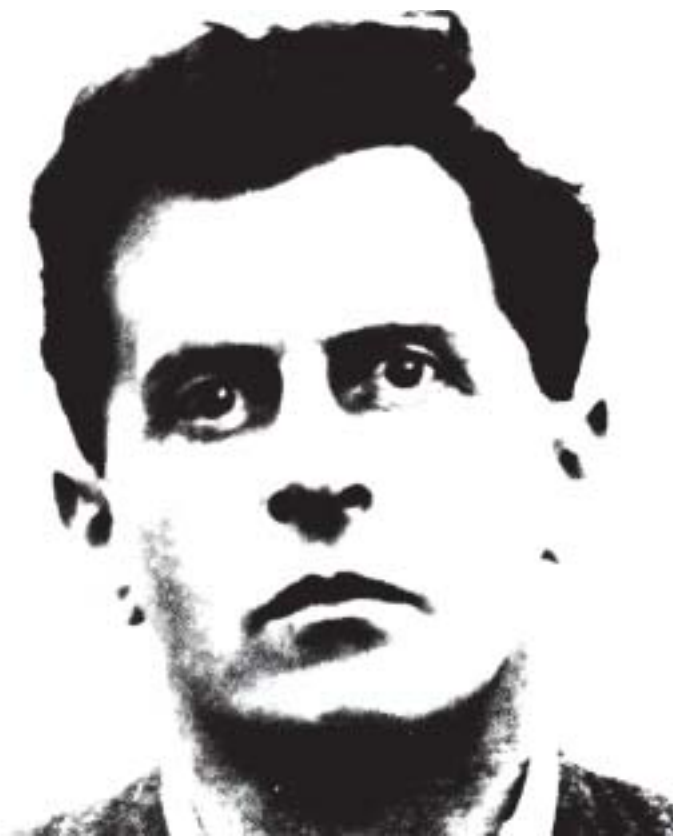
Wittgenstein / modificado

e no interior de formas de vida. Eis o que é suficiente supor a respeito do pensamento, durante a terapia gramatical. O pensamento não descobre ligações internas de sentido, mas, permanentemente, cria e modifica ligações – assim como quando jogamos um jogo (Wittgenstein 68, I, §83). Uma tal concepção de pensamento sugerida pela terapia, supõe exclusivamente conceitos operatórios cujo sentido pode ser explicitado através de aplicações e de exemplos – como é, aliás, o caso da significação conceitual em geral, segundo Wittgenstein.