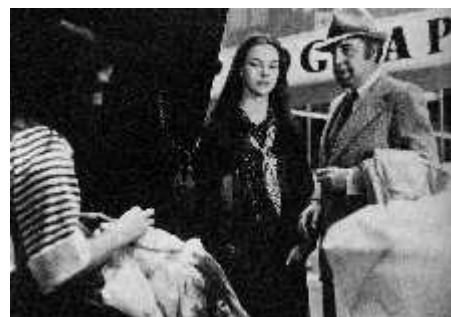
Esse Obscuro Objeto do Desejo - Buñuel

- A recorrência de elementos bizarros, que tendem ao grotesco, como partes decepadas do corpo humano, insetos,